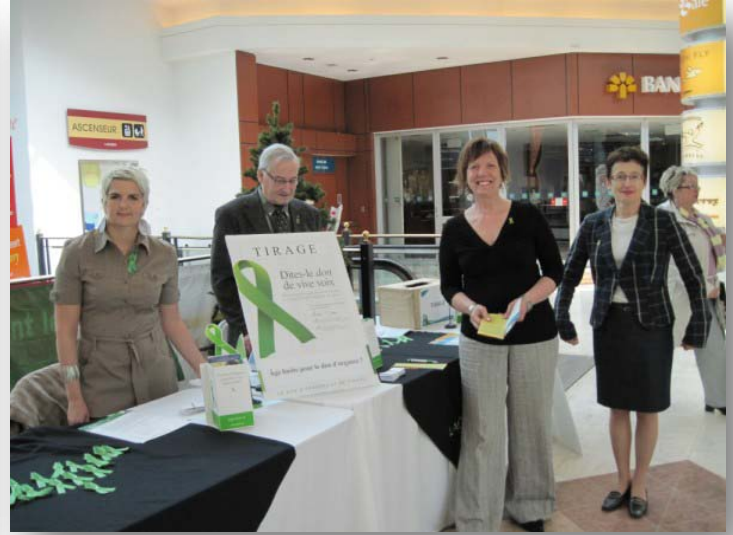
Kiosque à Laurier Québec (Québec)