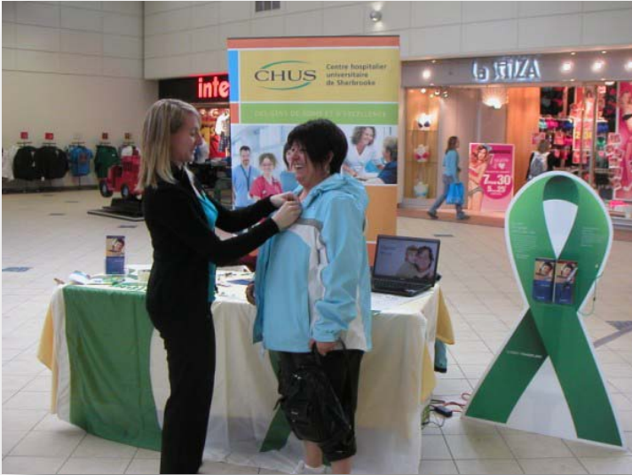
Kiosque au Carrefour de l'Estrie (Sherbrooke)