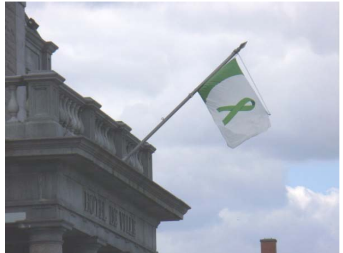
L'Hôtel de ville de Sherbrooke

Suivant le pas des 12 municipalités situées sur le territoire de la MRC Pierre-De Saurel qui avaient déployé le drapeau officiel du don d'organes l'an dernier et cette année encore, le drapeau du ruban vert a aussi gagné d'autres adeptes dans plusieurs municipalités, dont celle de Magog, Repentigny, Sherbrooke et Trois-Rivières. Plusieurs centres hospitaliers ont également déployé le drapeau à l'intérieur de leur établissement, et même dans certain cas, à l'extérieur, comme à l'Hôtel-Dieu d'Amos.