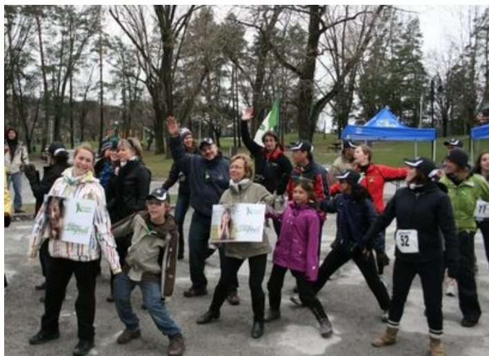
Des équipes, composées de deux à six personnes, se relayaient à la marche ou à la course. Des greffés étaient sur place et ont partagé leurs témoignages. Partenaires, bénévoles et animateurs étaient également de la partie.

Pose un geste est un organisme qui a pour objectif de promouvoir le don d'organes et de tissus. En plus de la sensibilisation, il organise des activités de financement pour répondre aux besoins des personnes en attente ou greffées.