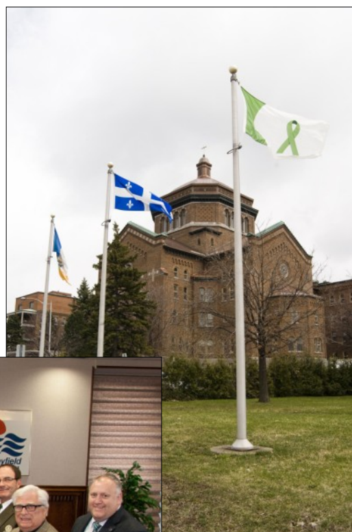
Hôpital du Sacré-Cœur de Montréal