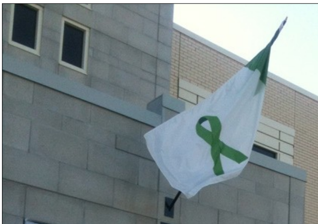
CSSS de Matane