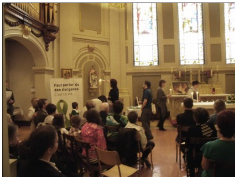
À Québec, la cérémonie de reconnaissance des familles de donneur avait lieu à la Basilique-cathédrale de Québec.