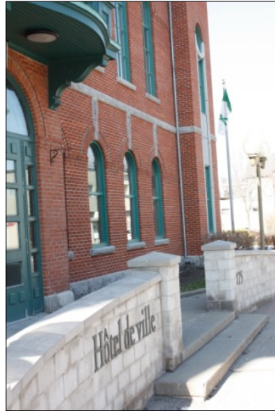
Ville de Lévis