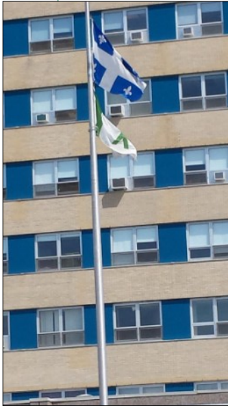
Centre hospitalier Les Eskers, à Amos

Encore cette année, plusieurs villes ont adhéré à la levée officielle du drapeau à l'effigie du ruban vert. Ce sont 78 villes et municipalités qui étaient de la partie en 2014. Merci aux maires, conseillers municipaux et citoyens qui ont fait de cette semaine une réussite. Quelques centres hospitaliers ont également emboîté le pas en organisant une levée officielle de drapeau.