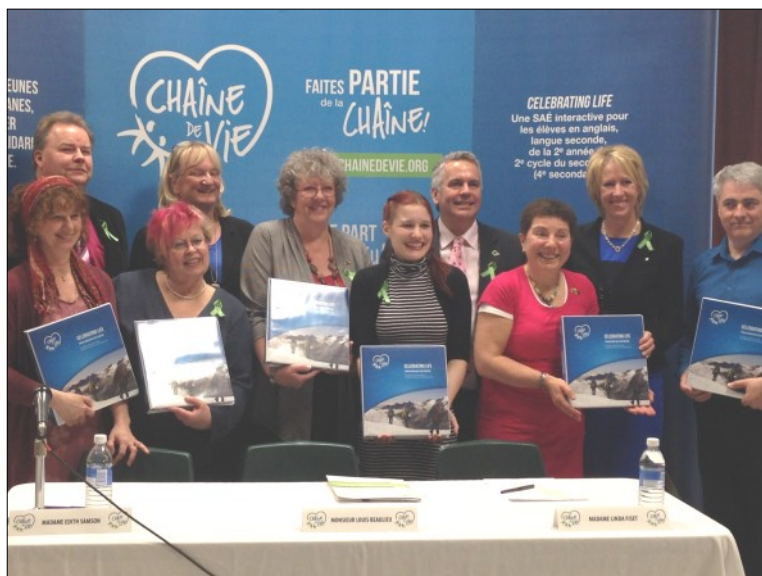
Représentants de la Commission scolaire Kamouraska-Rivière-du-Loup (CSKRDL), du partenaire Desjardins et de Transplant Québec étaient présents lors de la conférence de presse organisée par la CSKRDL pour souligner le lancement de la trousse pédagogique de CHAÎNE DE VIE, le 17 avril dernier, à Rivière-du-Loup.

Il y a cinq ans, pendant la Semaine nationale du don d'organes et de tissus, le site web du projet CHAÎNE DE VIE (à l'époque appelé « Chêne de vie/Chaîne de vie ») était lancé. Aujourd'hui, le projet a pris son envol et commence à s'intégrer en milieu scolaire à travers le Québec. Le 17 avril marquait une nouvelle étape : le lancement de la trousse pédagogique à Rivière-du-Loup, berceau du projet. L'équipe pédagogique, de concert avec Transplant Québec, a présenté la nouvelle trousse éducative interactive à l'intention des enseignantes et enseignants en anglais, langue seconde, de la quatrième secondaire. Le projet a pour objectif de sensibiliser les élèves sur le don d'organes et de tissus, tout en les invitant à prendre soin de leur santé, et ce, en adoptant de saines habitudes de vie. Ce projet unique est rendu possible grâce à une étroite collaboration entre les milieux de l'éducation et de la santé, de même qu'à l'engagement de différents partenaires, dont Desjardins à titre de partenaire principal.