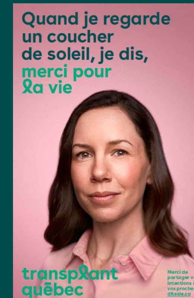
Affiches imprimables 11 x 17 pouces