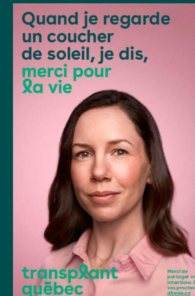
Affiches imprimables 11 x 17 pouces